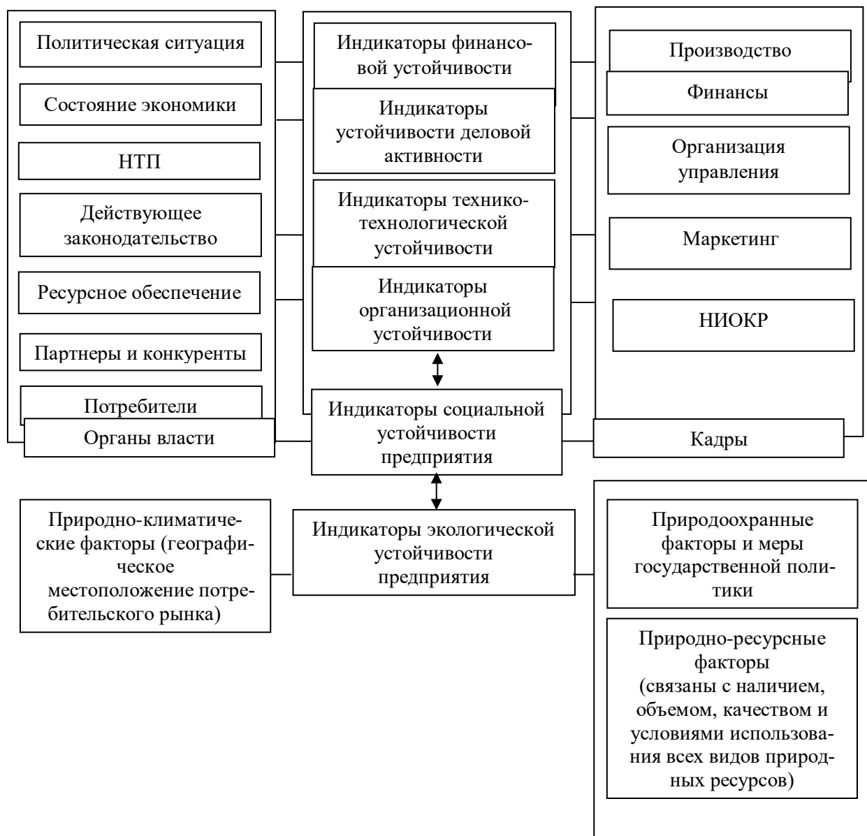
Рис. 1. Влияние факторов внешней и внутренней среды на индикаторы устойчивого развития компании

Из схемы видно, что одни факторы влияют на большинство показателей устойчивого развития компании, а другие – лишь на некоторые. Это понимание позволяет принимать эффективные решения при разработке стратегических целей и задач и анализе полученных результатов устойчивости компании.